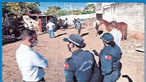
16 animais em situação de maus-tratos, no Jardim Monte Cristo

Prestação de Contas Ações à causa animal 17/05/2022