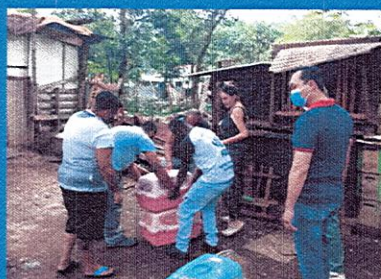
Mais de 60 animais são resgatados em situação precária